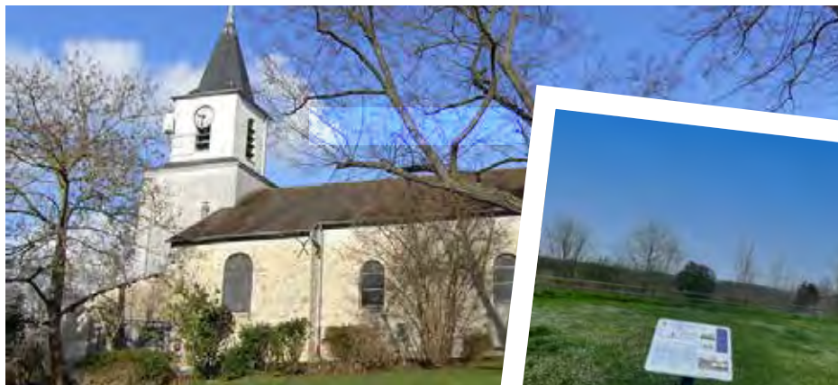
← Église Saint-Christophe

Enfin, la ville est desservie par quelques lignes de bus. Ayant un fort attrait pour les mobilités douces, Châteaufort compte plusieurs voies cyclables et piétonnes.